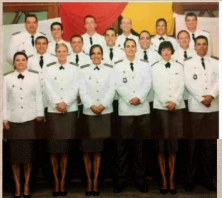
Primeira turma de oficiais com curso de Direito da BM